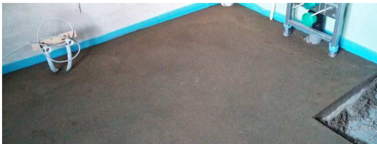
Exemples de mises en place de la bande de rive RAGREBAND

Ce document technique peut faire l'objet de mise à jour, il est de la responsabilité de l'utilisateur de contrôler systématiquement si une version plus récente est disponible sur notre site www.cermix.ch . Il est de la responsabilité de l'applicateur de contrôler la compatibilité des produits retenus et son chantier. Des essais peuvent être réalisés au préalable pour valider le bon comportement des produits. Notre Assistance Technique est à votre disposition au +41 22 354 20 60. Les conseils qui y sont prodigués ne prévalent pas sur les responsabilités de l'entreprise de pose.